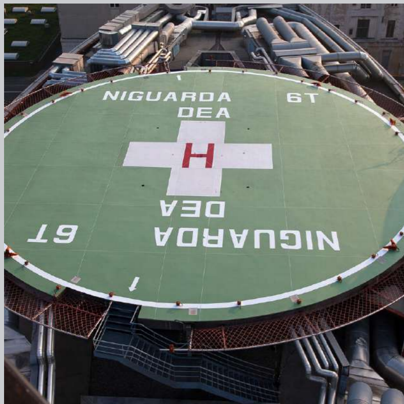
La nostra referenza: piattaforma elisoccorso Ospedale Niguarda Milano