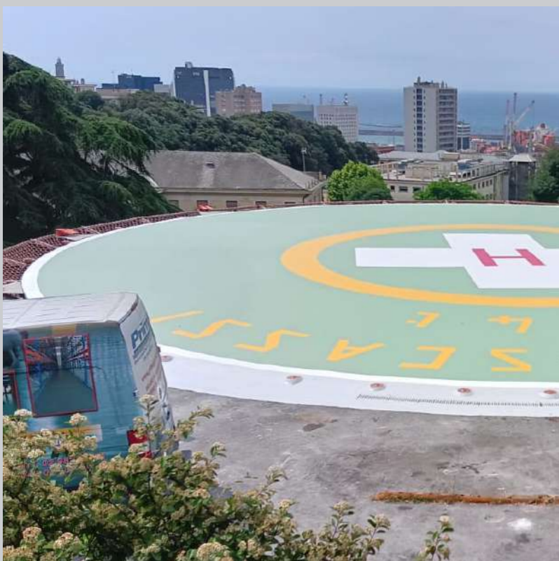
Project: Villa Scassi Hospital heliport - Genova - Italy