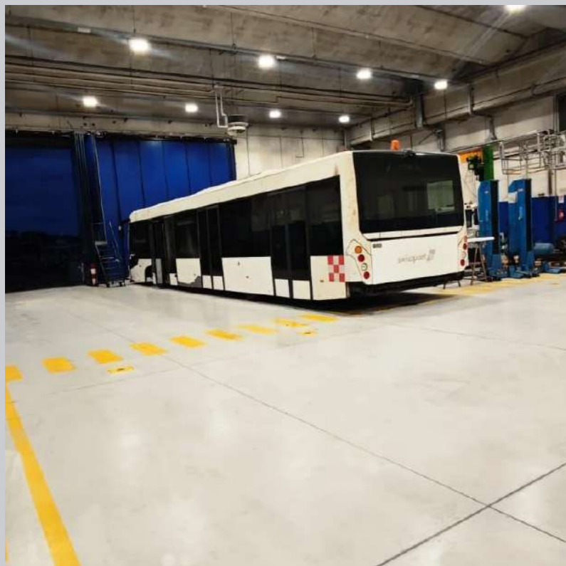
La nostra referenza: Officine Aeroporto Roma - Fiumicino (RM)