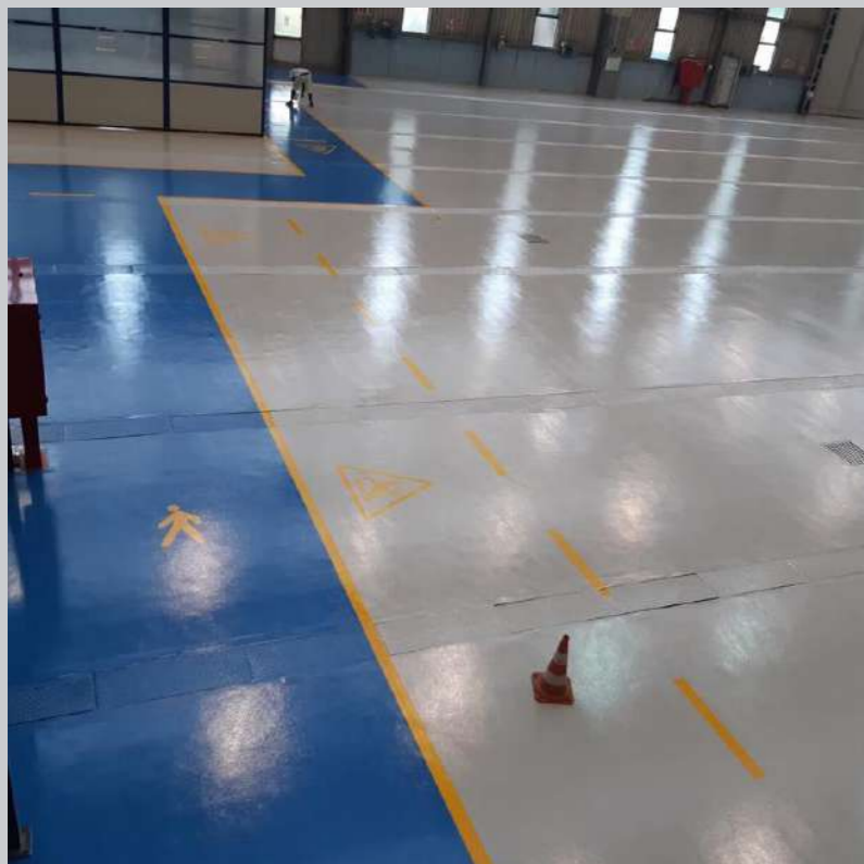
La nostra referenza: Hangar Leonardo - Venegono (VA)