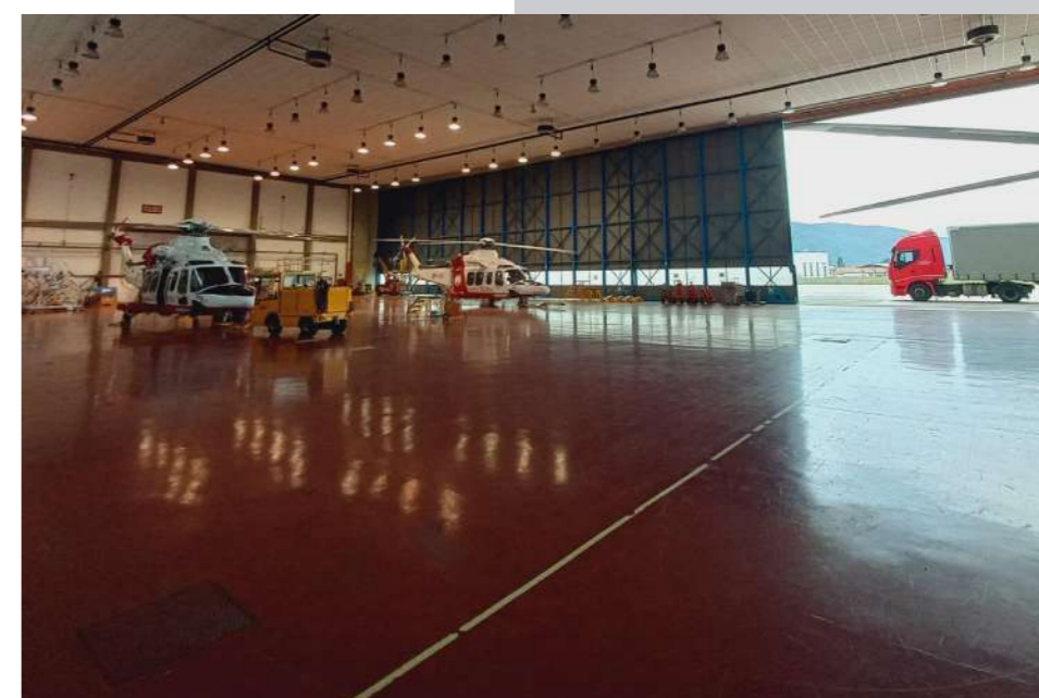
Guardia Costiera Luni Sarzana (SP)