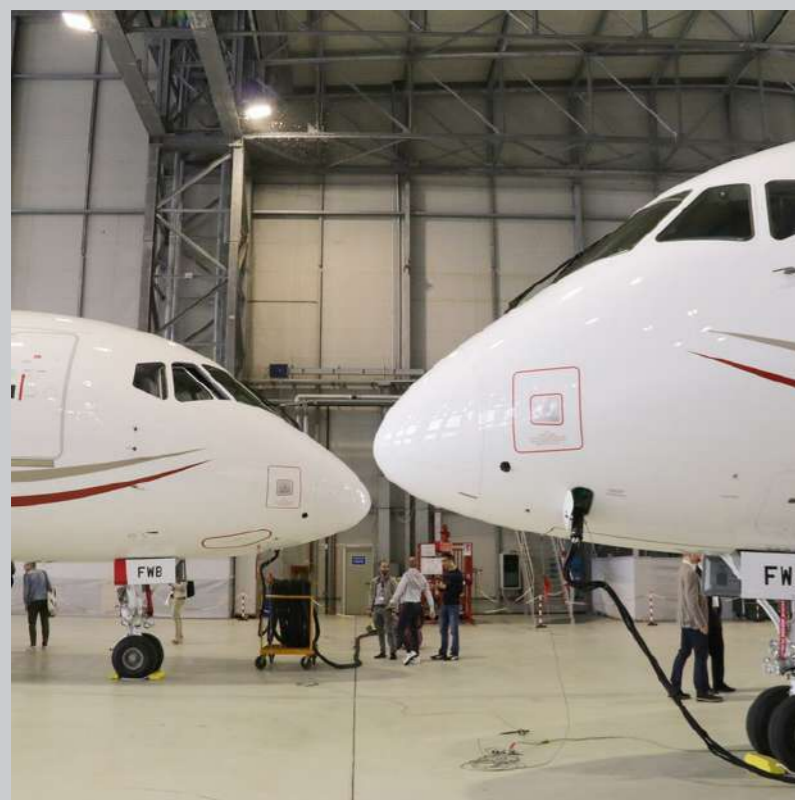
La nostra referenza: Hangar Aeroporto di Tessera (VE)