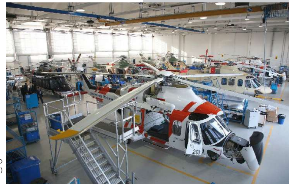
Leonardo Vergiate (MI)